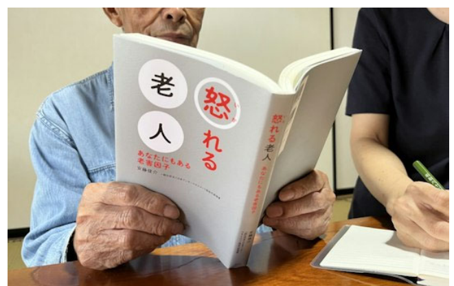
怒りを感じた場面を書き出し整理するのもよい